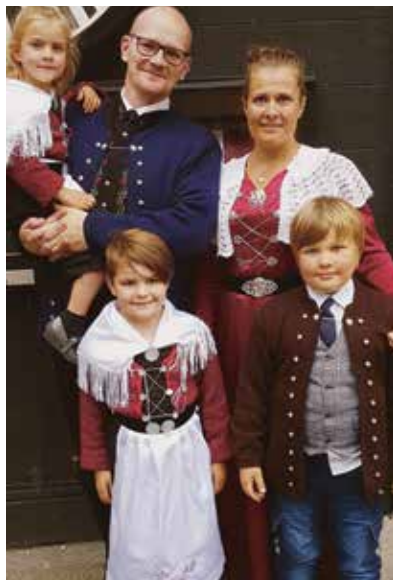
Optimistisk familie i stasklede: - Me er ikkje fleire enn me treng vera, og då må me laga fleire born!