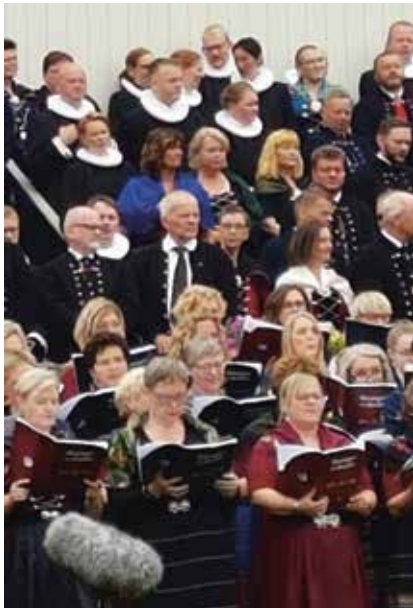
I lag med alle andre kjem prestane frå alle sokn på Færøyane til Olsok-feiringa, og dei går alle med pipekragar.

Olsok – olavsøku – på Færøyane er ei messe verd.